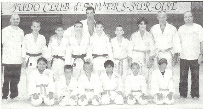
Le Voi Judo compte devenir le meilleur club du département.